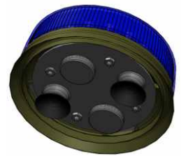
LP400 SOLARIS Abmessungen in mm